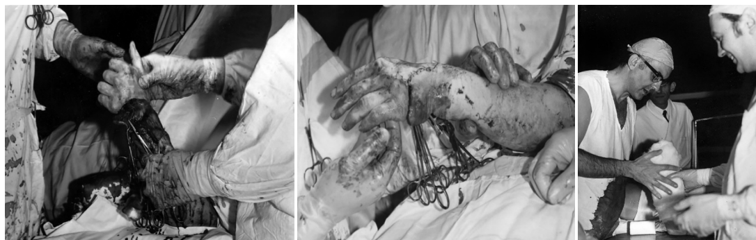
Ryc. 10-12. Pierwsza próba replantacji kończyny górnej w Klinice Chirurgii Ręki. 18 grudnia 1971 r.