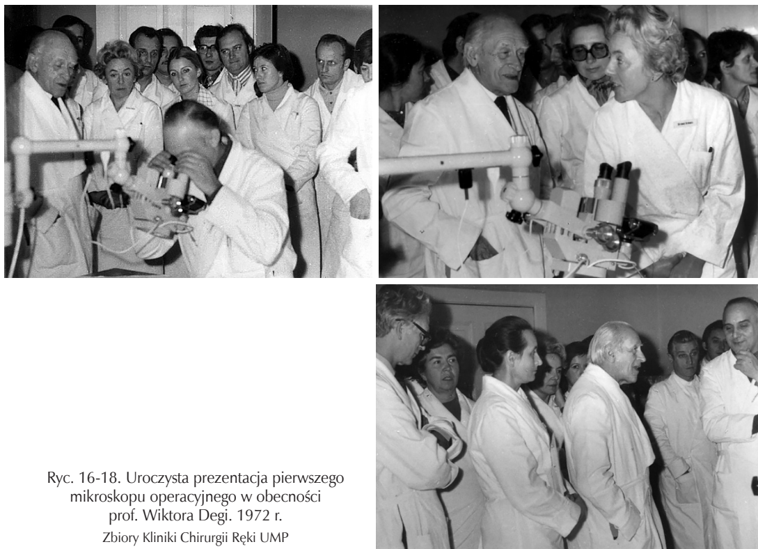
Ryc. 16-18. Uroczysta prezentacja pierwszego mikroskopu operacyjnego w obecności prof. Wiktora Degi. 1972 r.