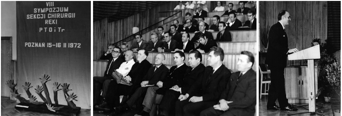
Ryc. 13-15. VIII Sympozjum Sekcji Chirurgii Ręki w Poznaniu. 1972 r.