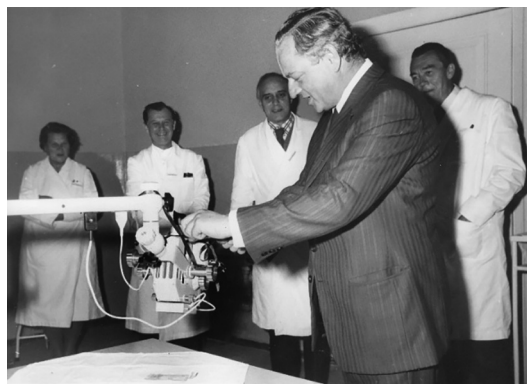
Ryc. 21-23. Odwiedziny poznańskiej Kliniki Chirurgii Ręki przez światowej sławy chirurgów ręki.