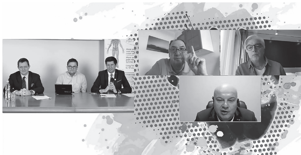
Ryc. 4. Prezentacje oraz dyskusje w formie hybrydowej

spowodowanych pandemią, ale okazała się bardzo atrakcyjna i została wysoko oceniona przez uczestników 6 .